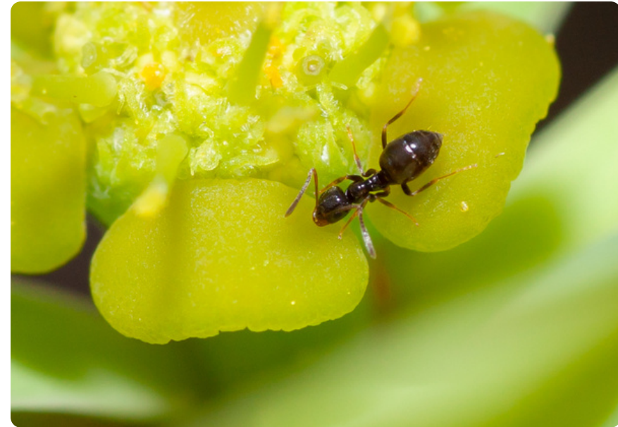
Plagiolepis schmitzii (obrero), en Euphorbia balsamifera .

Forman sus colonias en el interior de arbustos muertos o tocones de árboles. Es una especie cazadora, aunque es frecuente verlas recolectando néctar de flores, así como melaza de pulgones. Es una especie muy dominante y territorial.