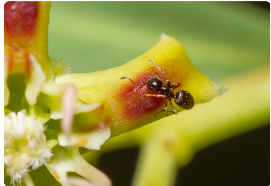
Plagiolepis schmitzii (obrero), en Periploca laevigata .