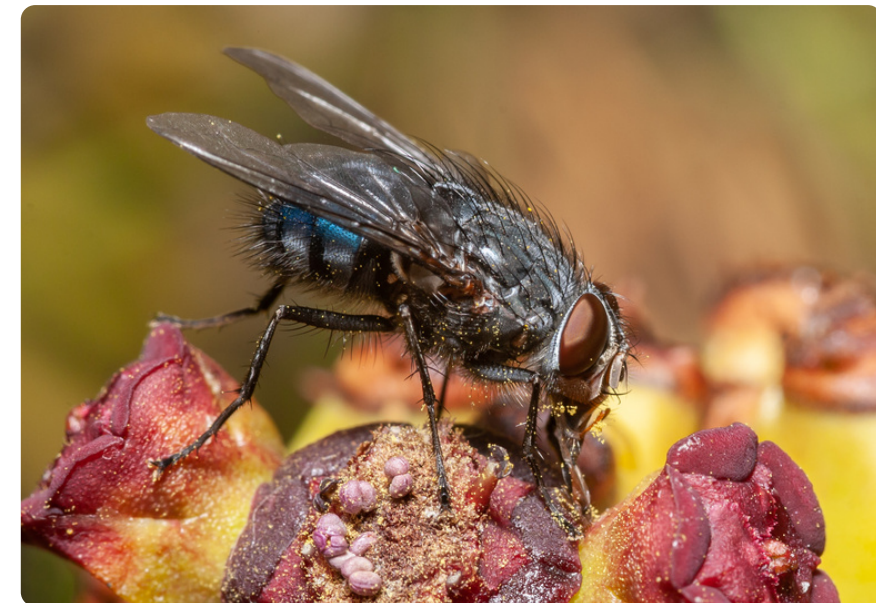
Calliphora vicina (macho), en Euphorbia canariensis .