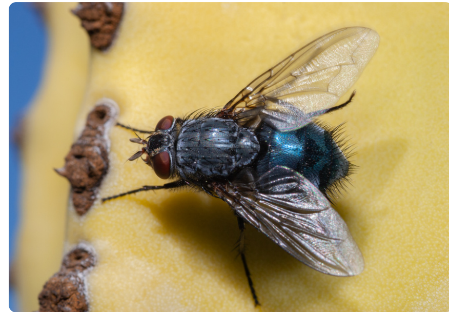
Calliphora vicina (hembra).

Las larvas se desarrollan en cadáveres de animales, alimentándose de los tejidos en descomposición. También pueden alimentarse en heridas abiertas de animales vivos, incluyendo al ser humano.