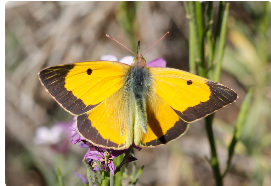
Colias croceus (macho), en Erysimum albescens .