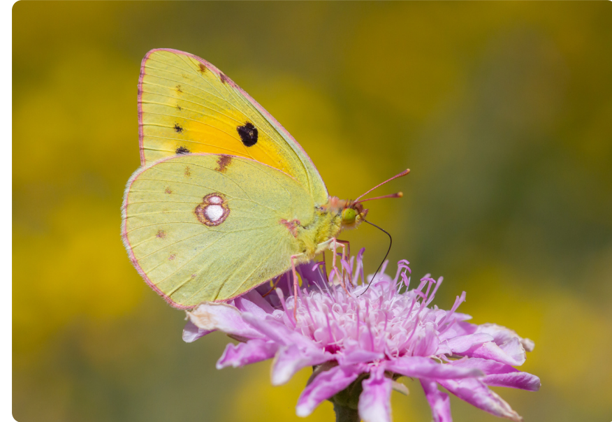
Colias croceus (hembra), en Pterocephalus lasiospermus .

Las larvas se alimentan de diversas especies de plantas de la familia Fabaceae , como Trifolium , Lotus o Chamaecytisus .