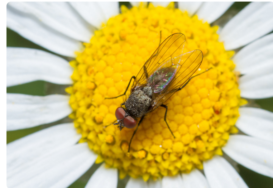
Delia platura (macho), en Argyranthemum frutescens .