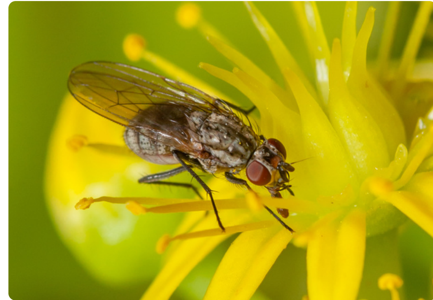
Delia platura (hembra), en Aeonium arboreum

La dieta de las larvas es extremadamente amplia, incluyendo tanto materia vegetal como animal, lo cual le permite prosperar en ambientes muy variados. Se considera una plaga en diferentes tipos de cultivos.