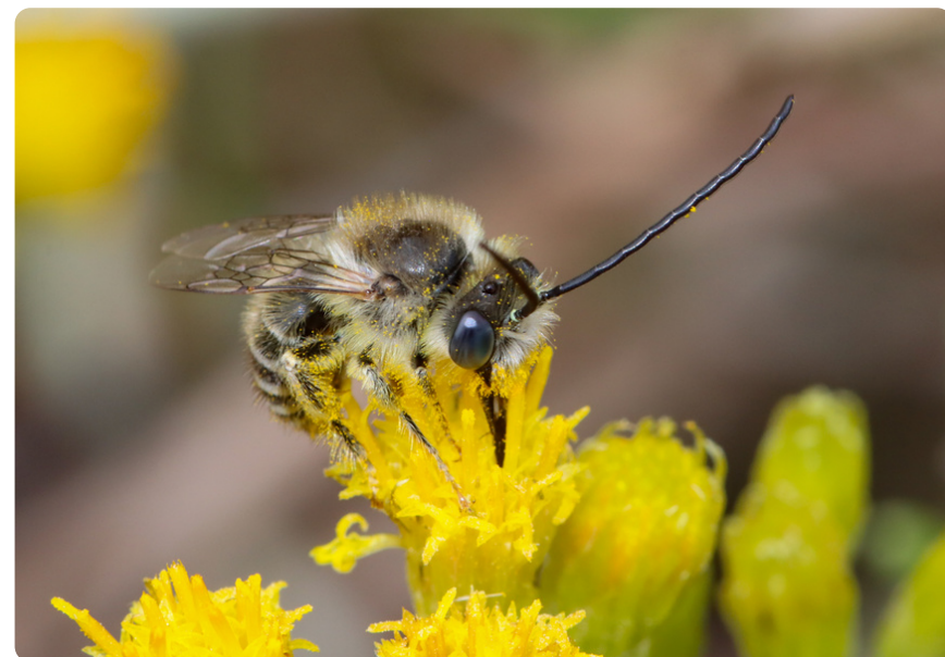
Eucera maroccana (macho), en Schizogyne sericea .