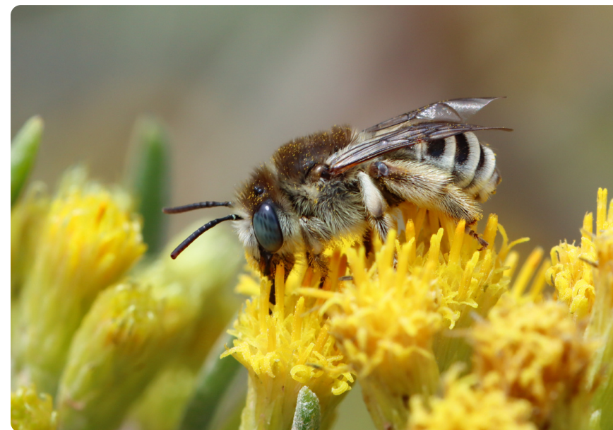
Eucera maroccana (hembra), en Schizogyne sericea .

Nidifica de forma gregaria en áreas llanas, despejadas de vegetación y de suelo compactado. Las hembras excavan nidos subterráneos, consistentes en un túnel principal, con varias ramificaciones, que terminan en las celdas de cría. En cada celda se desarrolla una larva alimentándose de la mezcla de polen y néctar recolectada por la hembra.