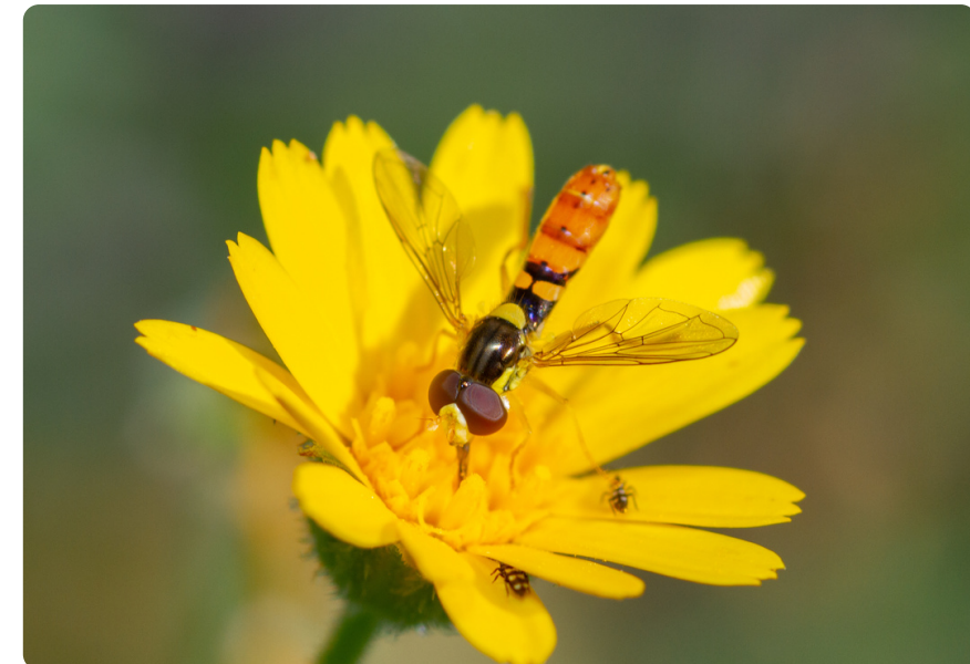
Ischiodon aegyptius (macho), en Drimia maritima .