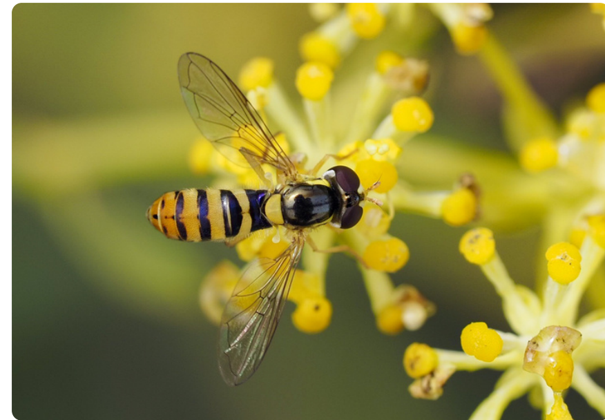
Ischiodon aegyptius (hembra), en Foeniculum vulgare .

Las larvas viven sobre la vegetación, tanto en plantas nativas como en ciertos cultivos, donde se alimentan de pulgones.