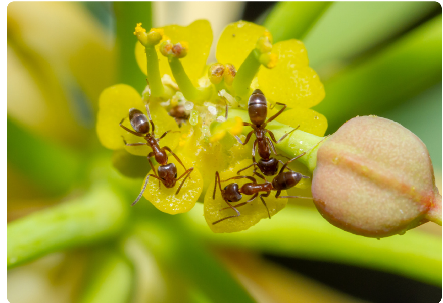
Linepithema humile (obreras), en Euphorbia lamarckii .