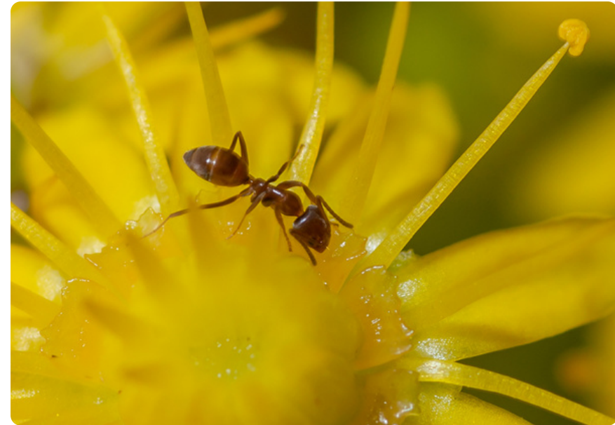
Linepithema humile (obrero), en Aeonium arboreum .

Construye sus nidos en lugares húmedos, incluyendo acumulaciones de materia vegetal descompuesta, debajo de piedras, grietas de paredes, etc. Es muy prolífica, con hormigueros que superan fácilmente los miles de individuos, hecho propiciado porque sus nidos son poligínicos, es decir, coexisten varias reinas en un mismo hormiguero. Esta característica le confiere un gran potencial invasor. Es una especie oportunista y aprovecha cualquier fuente de alimentación. Es habitual verlas alimentándose de néctar y de las secreciones de pulgones y cochinillas; los cadáveres de animales son otra importante fuente de alimento.