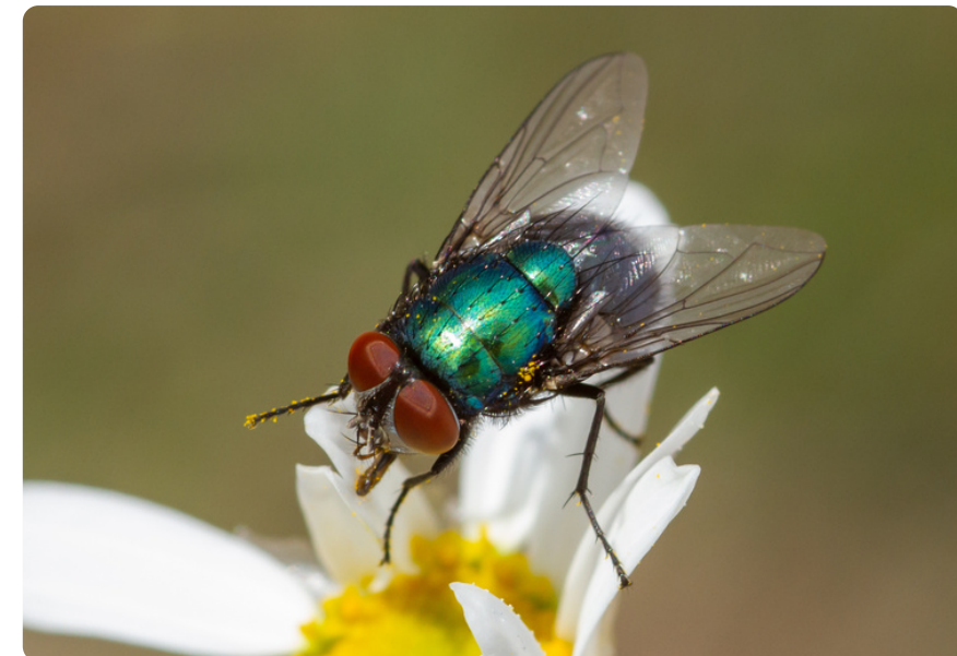
Lucilia sericata (macho), en Argyranthemum frutescens .