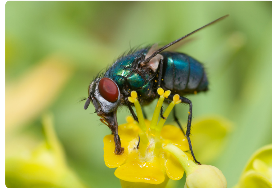
Lucilia sericata (hembra), en Euphorbia lamarckii .

Las larvas normalmente se desarrollan en cadáveres de animales, aunque también pueden encontrarse en materia vegetal en descomposición, incluyendo el estiércol.