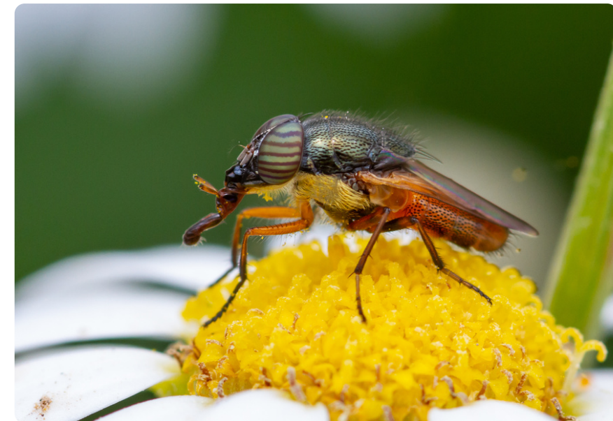
Rhinia apicalis (macho), en Argyranthemum frutescens .