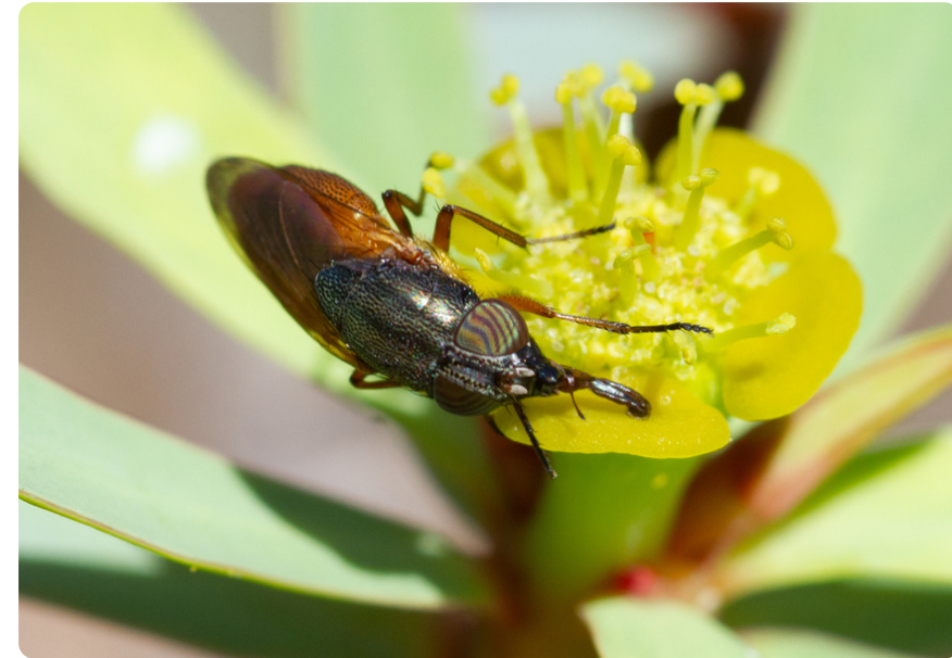
Rhinia apicalis (hembra), en Euphorbia balsamifera .

La biología de esta especie es poco conocida, aunque se han encontrado sus larvas asociadas a nidos de avispas y de hormigas.