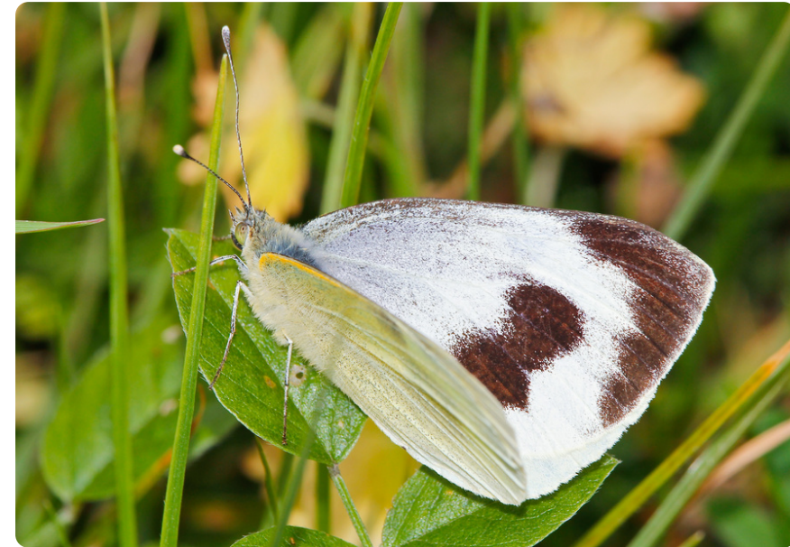
Pieris cheiranthi (hembra).

Las larvas se alimentan principalmente de plantas de la familia Brassicaceae , como Crambe , Brassica , Descurainia , Sisymbrium o Erucastrum . Alternativamente, también puede desarrollarse sobre Tropaeolum .