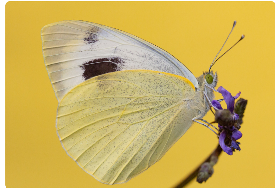
Pieris cheiranthi (macho), en Lavandula canariensis .