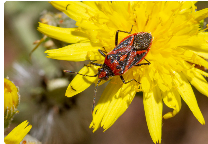
Corizus hyoscyami (hembra), en Tolpis sp.

Las ninfas se desarrollan normalmente sobre las mismas plantas herbáceas cuyas flores visitan los adultos, alimentándose de savia.