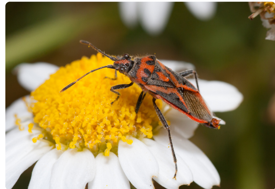
Corizus hyoscyami (macho), en Argyranthemum frutescens .